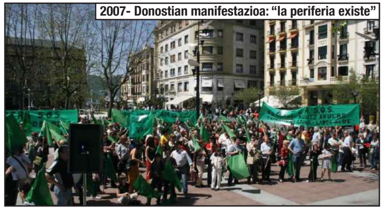
2007- Donostian manifestazioa: "la periferia existe"