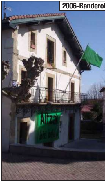
2006-Banderola berdearen kampaia