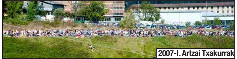
2007-I. Artzai Txakurrak