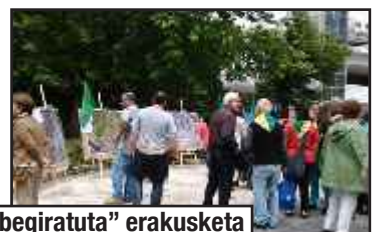
2013- "Altza goitik begiruta" erakusketa