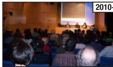
2010- Koldo Mitxelena hitzaldia