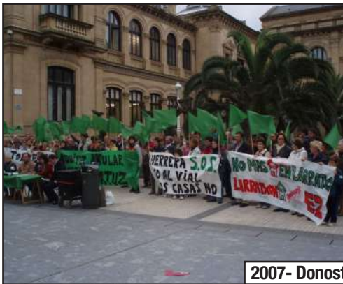
2007- Donostian agerraldiak