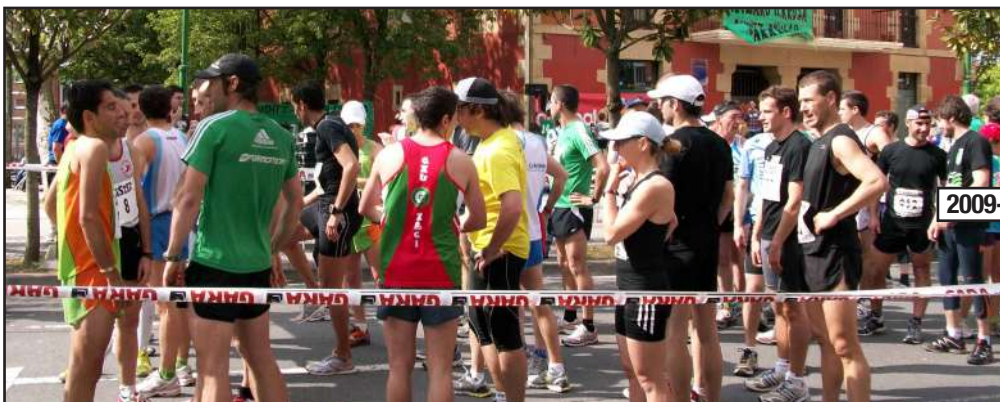
2009-14- Herri krossa 6 urtez