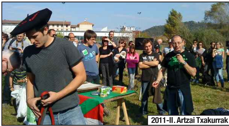
2011-II. Artzai Txakurrak