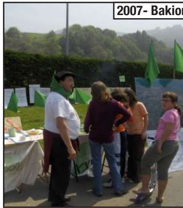
2007- Bakion Lurraren eguna