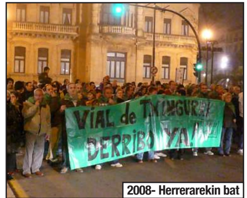
2008- Herrerekin bat