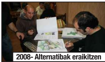
2008- Alternatibak eraikitzen