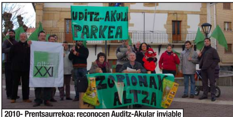
2010- Prentsurrekoa: reconocen Auditiz-Akular inviable