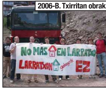
2006-B. Txirritan obrak