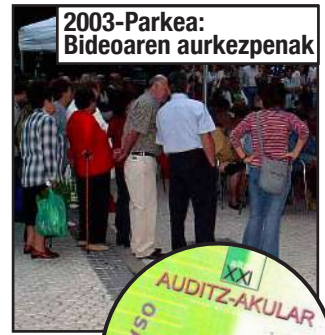
2003-Parkea: Bideoaren aurkezpenak