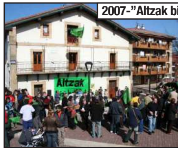
2007-"Aitzak bizi behar du" jaia